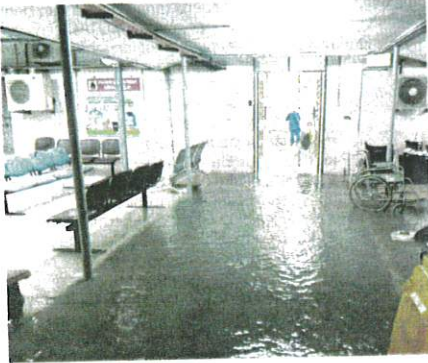
Limpahan air banjir memenuhi laluan pejalan kaki Hospital Tengku Anis (HTA) di Pasir Puteh.

PASIR PUTEH - Jabatan Kesihatan Negeri Kelantan (JKNK) bertindak pantas memindahkan 28 pesakit di Hospital Tengku Anis (HTA), di sini yang terjejas banjir sejak Ahad lalu.