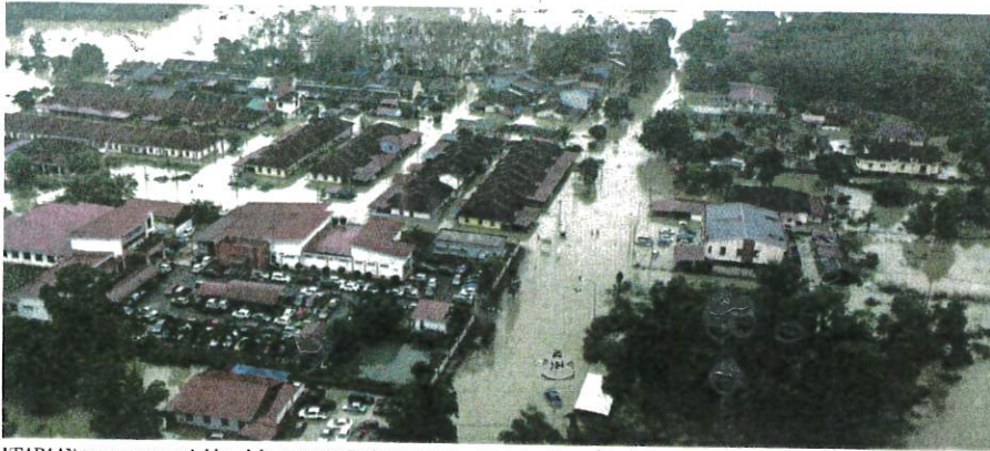
KEADAAN semasa menunjukkan laluan utama Pasir Mas-Rantau Panjang ditenggelami air separas 0.05 meter dan ditutup untuk semua kenderaan ringan.

Oleh Irwan Shafrizan Ismail am@hmetro.com.my