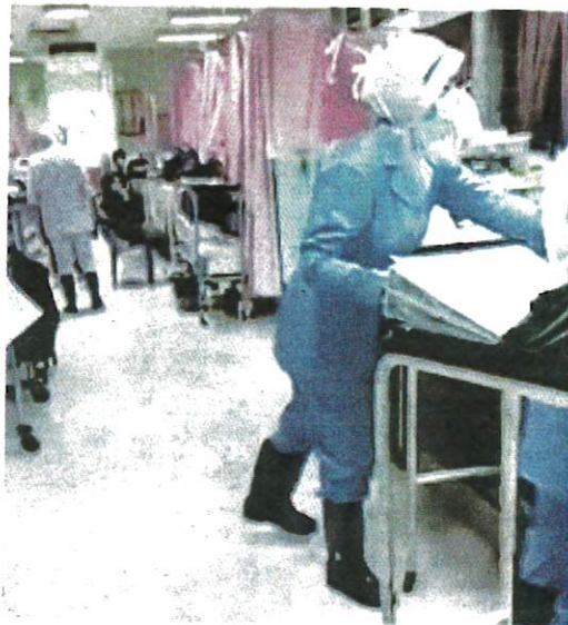
TANGKAP layar video yang memaparkan suasana di Hospital Tengku Anis, Pasir Puteh yang dinaiki air kelmarin.

"Di Terengganu pula, 40 fasiliti kesihatan dilaporkan terjejas melibatkan 27 klinik desa, lima klinik kesihatan, empat klinik pergigian, tiga Pejabat Kesihatan Daerah dan satu unit vektor di Jabatan Kesihatan Negeri," katanya.