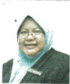
Felo Kanan, Pusat Kajian Ekonomi dan Kemasyarakatan (EMAS), Institut Kefahaman Islam Malaysia (IKIM)