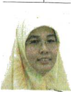
Pakar Perubatan Kesihatan Awam, Fakiulti Perubatan dan Sains Kesihatan, Universiti Putra Malaysia (UPM)